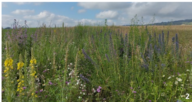
Saum «Saatsmischung für trockene Standorte» im zweiten Jahr