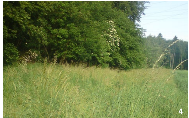
Saum an schattigem Standort: Die blütenreichen, krautigen Pflanzen können sich schlecht etablieren.