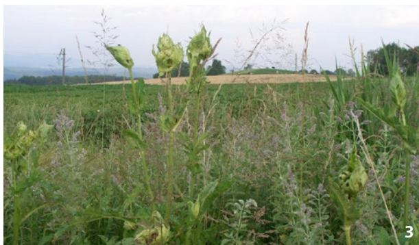
Saum «Saatsmischung für feuchtere Standorte»