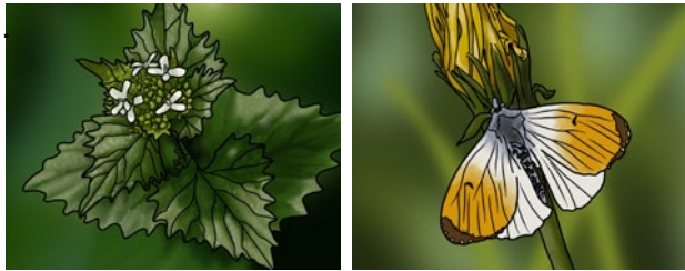
Bsp. Der Knoblauchhederich (enthalten in der Saatmischung für feuchte Standorte) ist eine wichtige Futterpflanze für die Raupe des Aurorafalters.